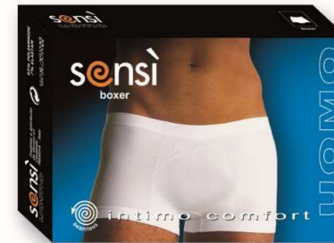
7351 Boxer weiß schwarz M-L-XL