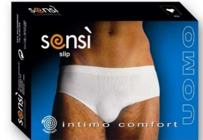
7350 Slip weiß schwarz M-L-XL

Material: 66% Polyamid 30% Cotton 4% ELastan