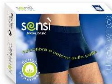
7354 Boxer anthrazit M-L-XL