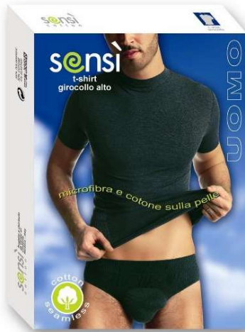
7153 T-Shirt anthrazit M-L-XL

Material: 66% Polyamid 30% Cotton 4% ELastan