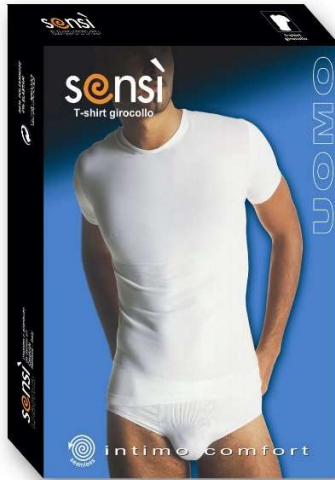
7151 T-Shirt weiß,schwarz M-L-XL