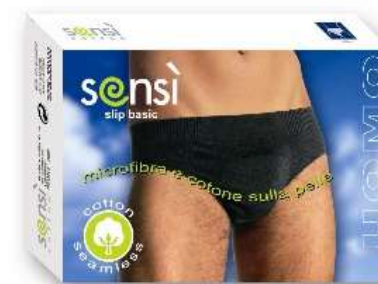
7353 Slip anthrazit M-L-XL